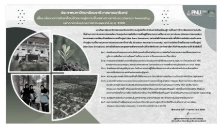
ประกาศนโยบายการขับเคลื่อนเป้าหมายสู่ความ https://www.pnu.ac.th/direct-to-president/

ข่าวสารและกิจกรรม รับสมัครนักศึกษา สมัครงาน ประกาศจัดซื้อจัดจ้าง PNU CHANNEL PNU RADIO