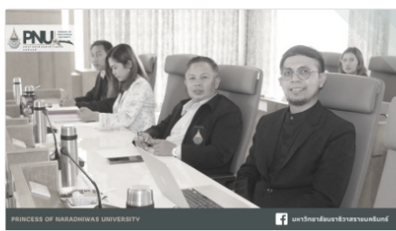
มหาวิทยาลัยนราธิวาสราชนครินทร์ จัดประชุม สภาวิชาการ เดินหน้าพัฒนาหลักสูตร เพื่อให้...