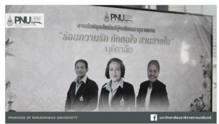
มหาวิทยาลัยนราธิวาสราชนครินทร์ จัดงานขอ พิกุลสัมพันธ์ฯ บุคลากรเกษียณอายุราชการ