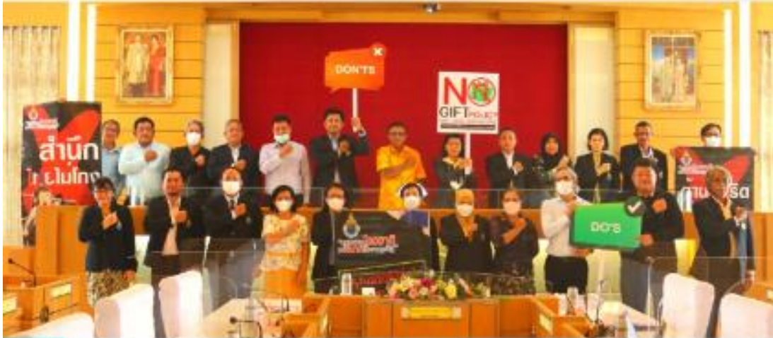
มหาวิทยาลัยนราธิวาสราชบัณฑิต จัดประชุมเสริมสร้างวัฒนธรรม นโยบายไม่รับของขวัญ (NO GIFT POLICY) และมาตรฐานทางจริยธรรมแก่เจ้าหน้าที่ของหน่วยงาน