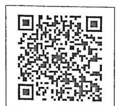
QR-Code เพื่อสอบถามข้อมูล