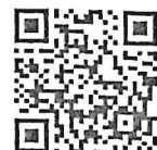
QR-Code เพื่อจองห้องพัก

โทรศัพท์: ๐๒-๔๒๒-๙๒๒๒ E-mail : rsvn@royalriverhotel.com